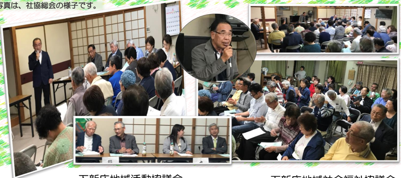
※写真は、社協総会の様子です。

最初に下新庄小学校校長と新教頭の挨拶、そして、小学校PTA並びに中学校PTAから役員挨拶もありました。総会では、社会福祉協議会の平成29年度の事業報告、会計報告、そして、平成30年度の事業計画案と予算案が提案され、承認されました。今年度は、役員改選ですので、会長継続の報告と役員の発表もされました。